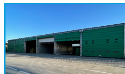
Piattaforma polifunzionale di stoccaggio – “Impianto Seveso”