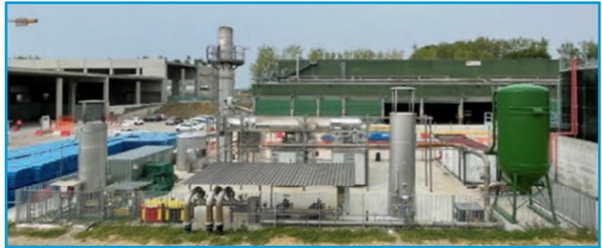
Centrale di cogenerazione a biogas – "Impianto Seveso"