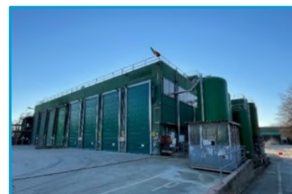
Impianto di inertizzazione – “Impianto Seveso”